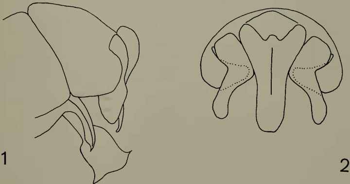
Fig. 1—2. Erebiomima moderata n. sp., männliches Hypopyg, von der Seite gesehen (1). Der Cercus ist in der apikalen Hälfte sehr dünn abgeflacht, die Surstyli sind breit. Penis glockenförmig. Vordere Parameren dreieckig mit scharfer Spitze, die hinteren nicht sichtbar (hakenförmig). Cercus und Surstyli von hinten gesehen (2). Die von der punktierten Linie eingeschlossene Fläche der Surstyli ist nicht sklerotisiert.

Zweites Abdominaltergit bis zur halben Länge ausgehöhlt, fast so lang wie das dritte. Je ein Paar nahe beieinanderstehende dorsale Marginalen auf II und III, ein Kranz auf IV und V. Ein Paar Diskalen (dem Vorderrand genähert)